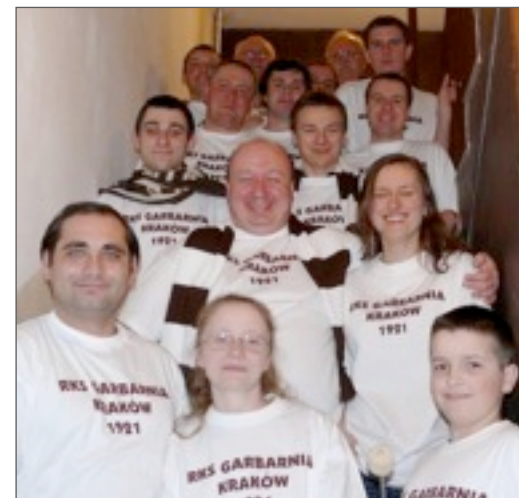
Spotkanie Klubu Kibica - marzec 2009.